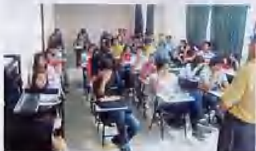
Bienvenida a las aulas.