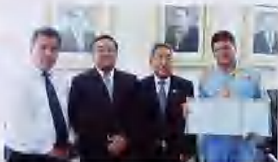
Acto y documentos de institucionalización.