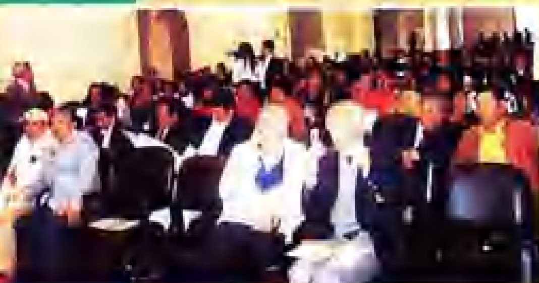
Presencia y trascendencia en la historia y en la sociedad.