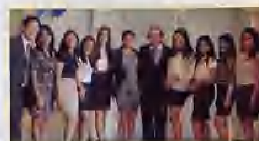
La Delegación de la Universidad Nacional de Trujillo con el Jefe de la Misión Permanente del Perú ante la OEA.