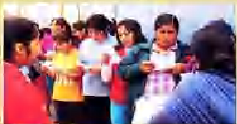
La Ley y lo social