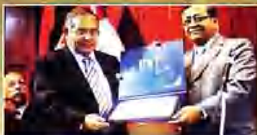
Presidente del Consejo Nacional de la Magistratura.